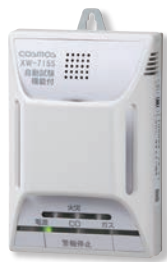
XW-715S (新コスモス電機製)