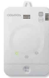
XW-125G (新コスモス電機製)