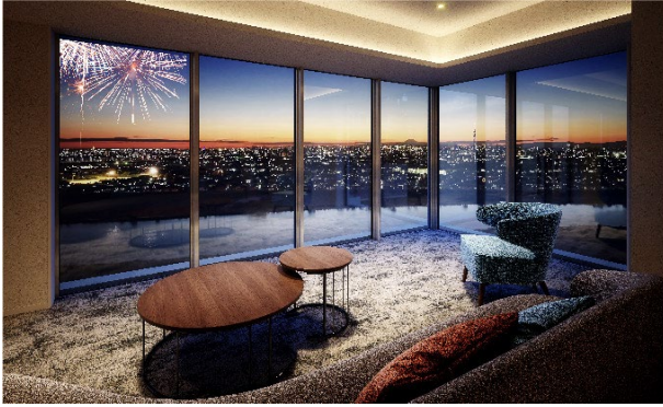
【スカイラウンジ完成予想 CG※6】

本物件では多様化するライフスタイルにお応えするため、多彩な共用空間をご用意。周辺に高層の建築物が少ない開放的な眺望を居住者様にお楽しみいただけるよう、27 階には「スカイラウンジ」を設けました。東京スカイツリー®や富士山に加え、夏になると市川市民納涼花火大会など※5、豊かな風景を堪能できます。また 1 階には「BIG LIVING」をコンセプトとした開放的な「エントランスラウンジ」を設け、「ワーキングラウンジ」や「キッズスペース」とシームレスにつながる空間としました。さらに、ご家族やご友人が宿泊できる 2 つの「ゲストルーム」をはじめ、居住者様のご要望にお応えする「コンシェルジュデスク」、スニーカーや布団まで洗濯可能な「ランドリースペース」、スムーズな入出庫が可能な「自走式駐車場」など、多様化する生活スタイルに対応した、豊かなライフシーンを創造します。