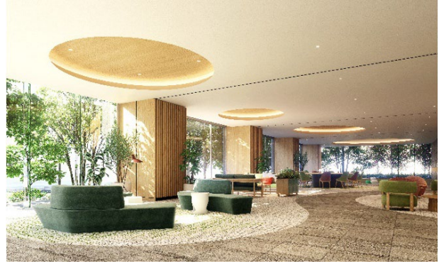
【エントランスラウンジ完成予想 CG】