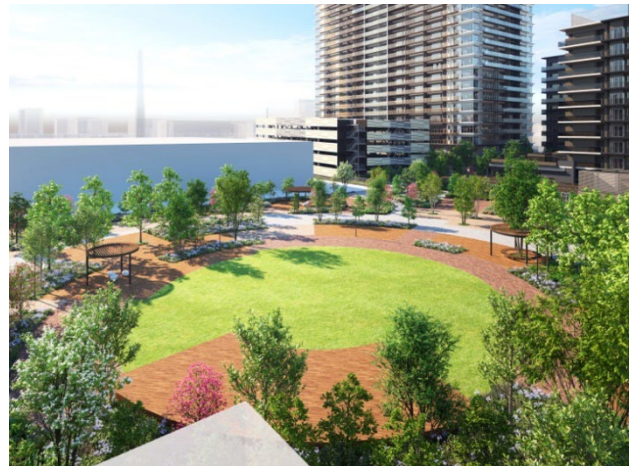
【中央広場完成予想 CG】