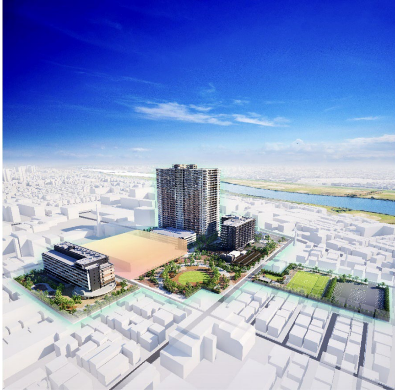
【「リーフシティ市川」全体街区完成予想 CG ※4 】

総武線沿線最大級、約 3.7ha の敷地面積を誇る「リーフシティ市川」には、日々の利便性や豊かな時間を創出する多彩な都市機能が集結しています。商業施設や地域の住民に開かれた中央広場、気兼ねなくボール遊びを楽しめる運動場のほか、常緑の美しいシンボルツリーやプロムナードの花々といった四季折々の瑞々しい風景が身近に寄り添います。さらに、本物件に加えて、賃貸住宅、シニア住宅をひとつの敷地内に計画することで、多世代型の複合開発を目指しました。