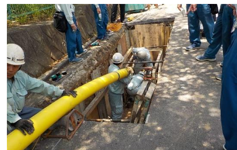
非開削工法の施工状況

道路の掘削面積を大幅に削減する非開削工法は、環境負荷軽減とコスト低減に貢献する工法です。当社はオリジナルの非開削工法の開発を進めるなど、積極的に非開削工法を導入しています。