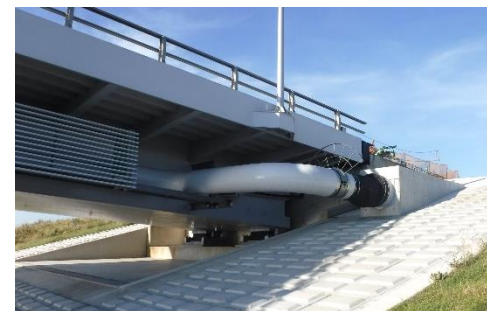
第二中央幹線（妙典橋）

また、将来にわたり天然ガスを安定的にお客さまに供給するために、大多喜ガス(株)さまと共同で設立した、なのはなパイプライン(株)により、新たなパイプラインの建設を進めます。