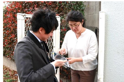
モバイル端末による接客

お客さま接点業務などのフィールド業務を中心にICT活用の推進を図り、より一層お客さまの利便性を高めるべくモバイル端末の導入やシステムの改善等を進めていきます。