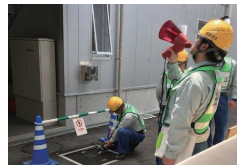
現場の初動措置・住民への避難勧告の訓練

「お客さまの安全確保を最優先」として、迅速な現場対応を確実に実施するため、2017年に運用を開始した緊急保安研修センターを活用した教育・訓練を強化して、現場において的確な判断・行動ができる保安のスペシャリストの育成を推進します。