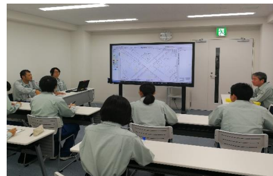
インターンシップ

また、次世代教育の一環としてエネルギーや環境問題に関心をもっていただくことを目的とした小学校での出張授業を実施するほか、ガス会社の職業体験を目的とした高校生・大学生が対象のインターンシップを引き続き実施します。