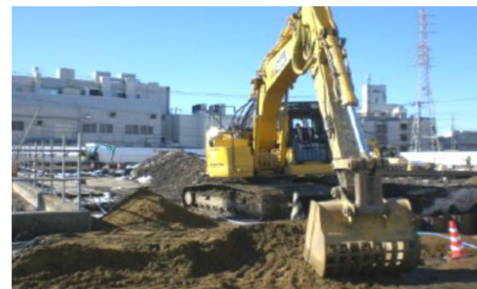
市川工場跡地整備工事

また、市川工場跡地の有効活用について検討を推進します。併せて整備工事を確実に実施していきます。