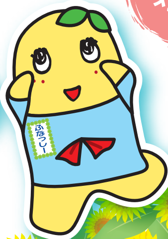
京葉ガスユーザー代表 梨の妖精「ふなっしー」 ©ふなっしー